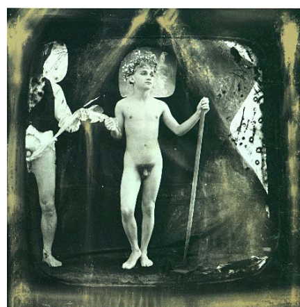
Man without legs, 1984 / Woman in a blue hat, 1985 / Von Gloeden in Asien, 1984