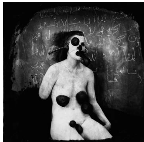
Venus and Eros in the Purgatory, 1981 / The Santo Oscuro, 1987 / Collector of Fluids, 1982