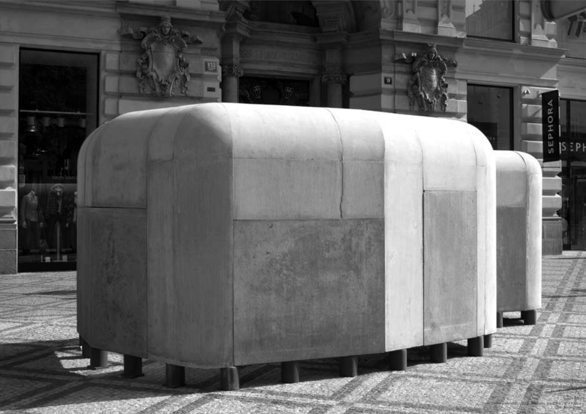
Vítěch Míča Bunkr (Něžné prefabrikáty), 2006, železobeton, cca 650 x 230 x 200 cm