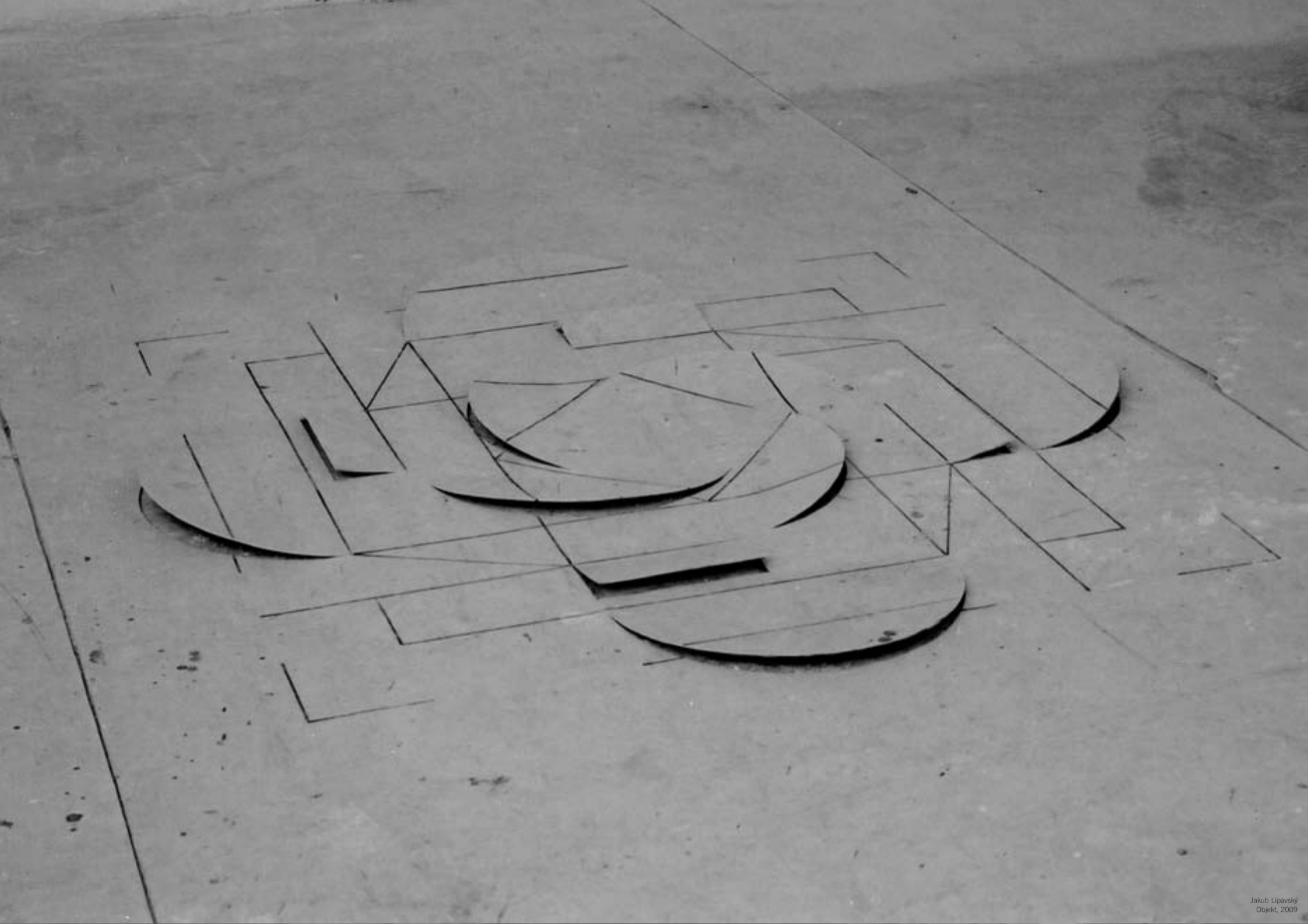
Jakub Lipavský Objekt, 2009