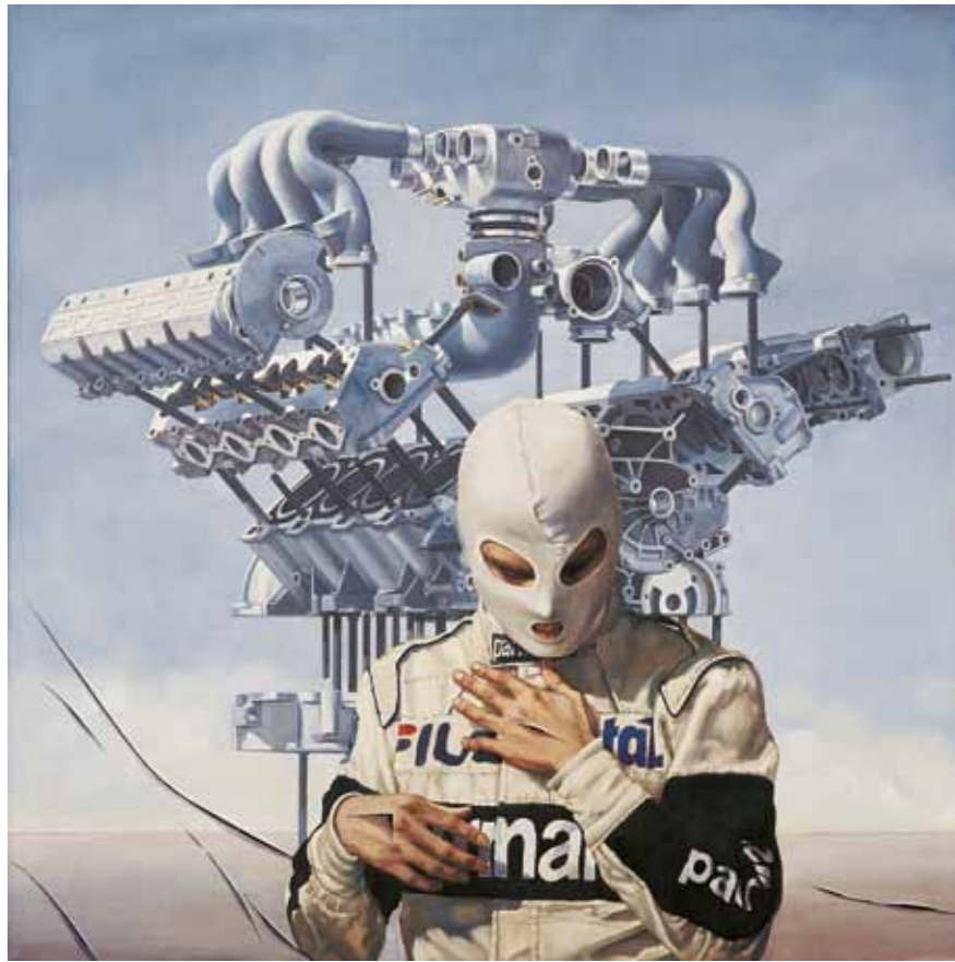
Ecce Homo , 1983, 140 × 140 cm, olej na plátně oil on canvas