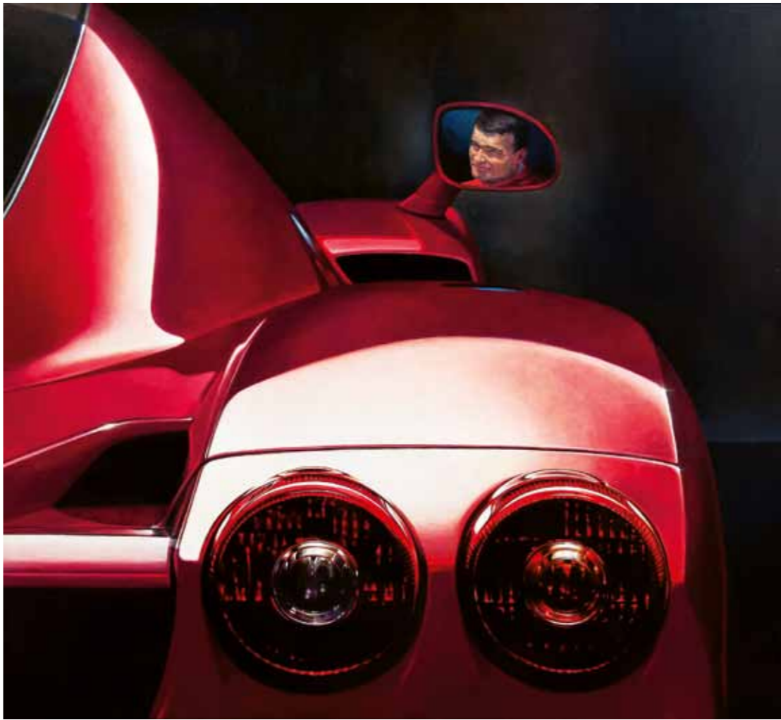
Portrét pana P. Portrait of Mr P., 2015, 100 × 105 cm, olej na plátně oil on canvas