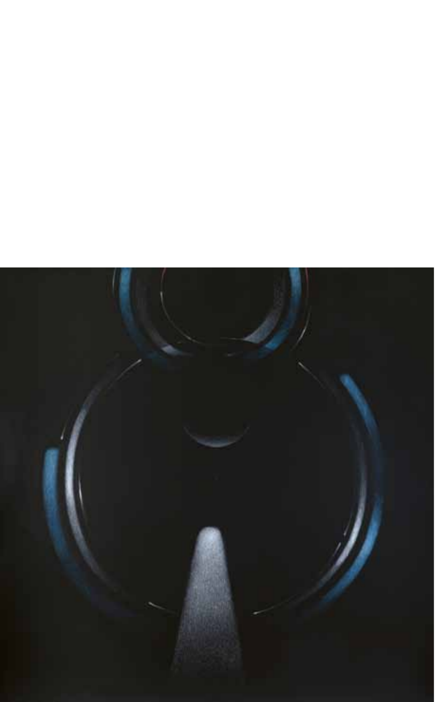
Rozmluva s Hawkingem Conversation with Hawking, 2019, 190 × 190 cm, barevné pastelky, mdf, dřevěný rám colour pencils, mdf, wooden frame