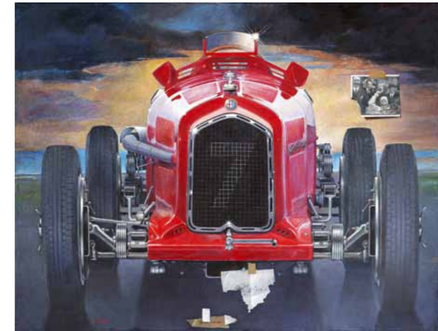
Adie, Guy Moll Adieu, Guy Moll, 1992–2017, 115 × 150 cm, olej na plátně oil on canvas