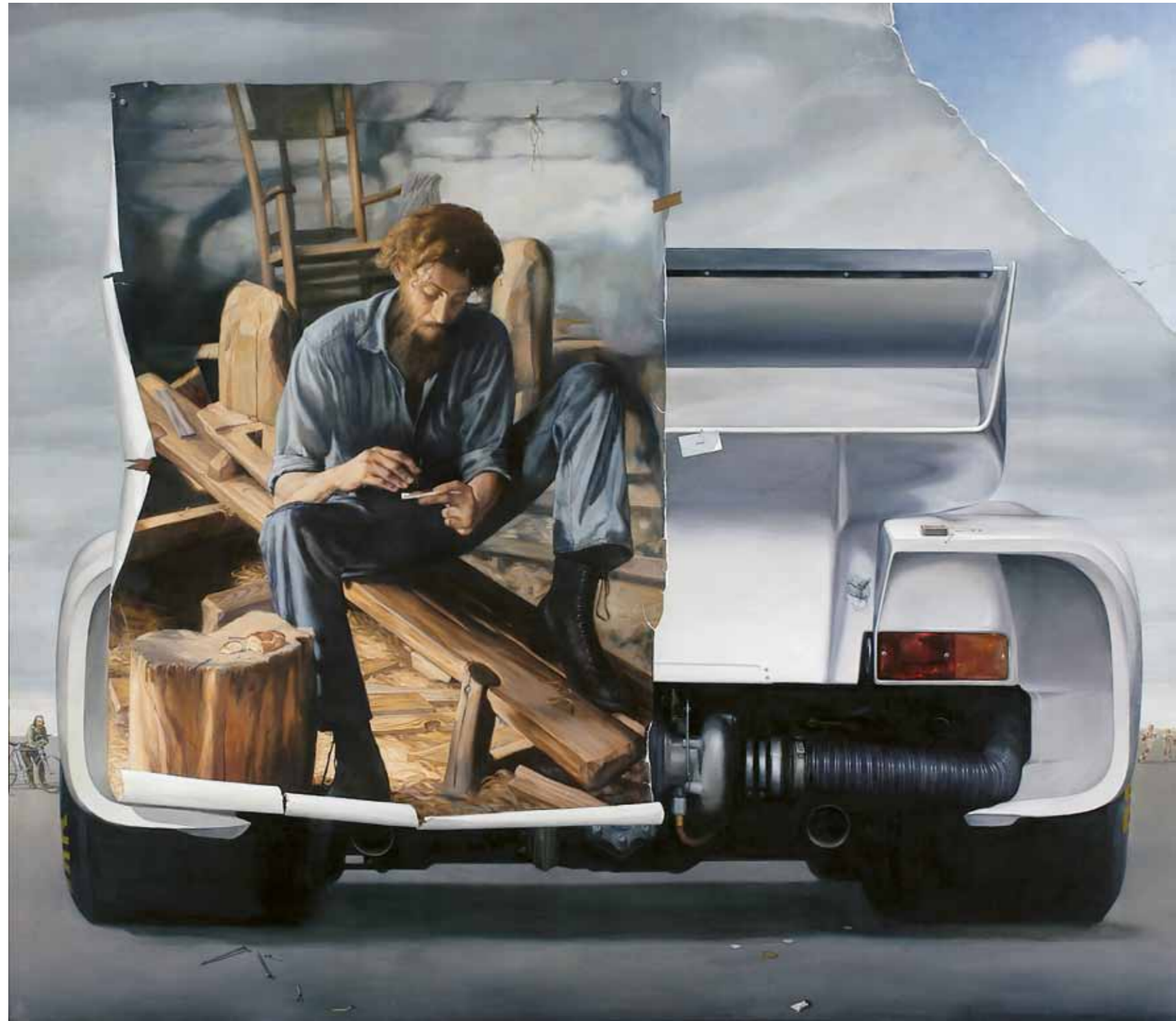
Josef N. , 1978, 180 × 200 cm, olej na plátně oil on canvas >

V současné době žije a pracuje v Mukařově.